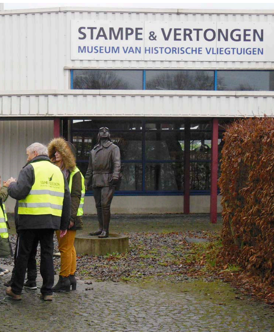
Op bezoek in een vliegtuigmuseum in je eigen buurt! Kinderen uit Deurnse scholen in Luchtvaartmuseum Stampe en Vertongen

'Ons museum bevindt zich in een kunstmatig grottencomplex van begin 19de eeuw, dat is ontegensprekelijk Deurns erfgoed. De collectie zelf mag je gerust "werelderfgoed" noemen: de mineralen, fossielen en archeologische artefacten komen van over heel de wereld. Aan kinderen