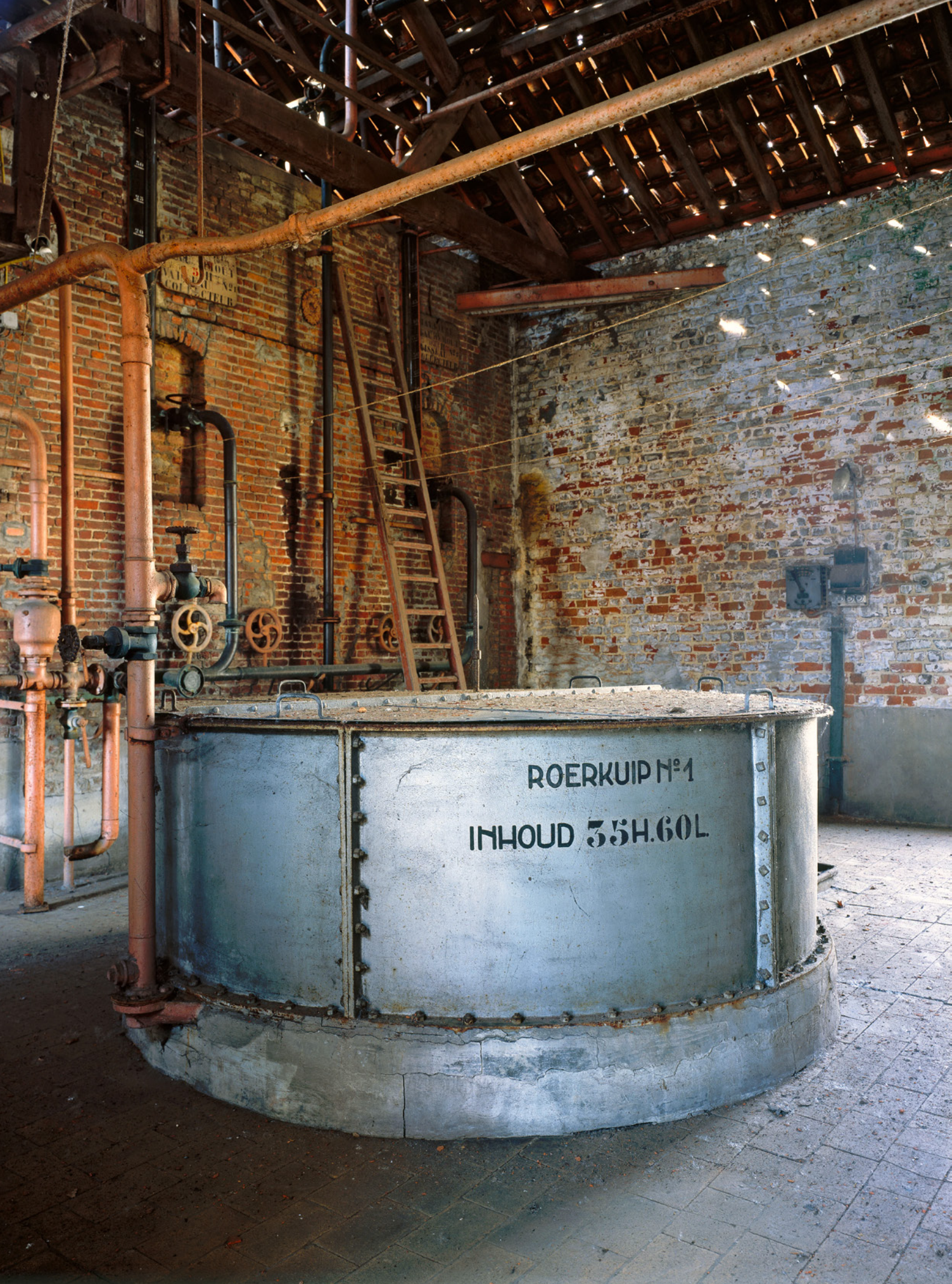
Dieper dan Shakespeare, hoger dan de kathedraal